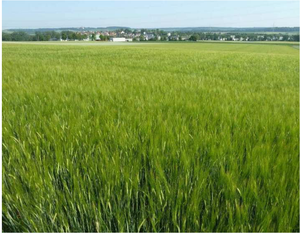
Teilaspekt des Plangebiets