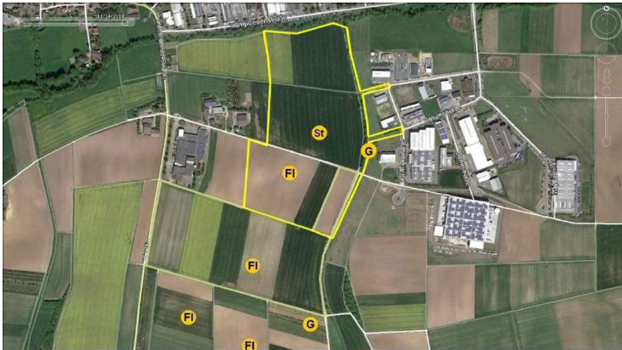
Abbildung 3 Revierzentren artenschutzrechtlich hervorgehobener Brutvogelarten im Plangebiet (gelb umrandet) und Kontaktlebensraum. FI - Feldlerche, G - Goldammer, St - Wiesenschafstelze.